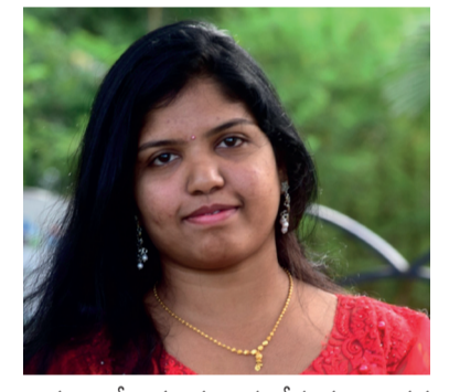
గొప్ప.. అనే పెద్దల మాటలను నేను పూర్తిగా సమర్థిస్తాను.. ఆచరిస్తాను..

చేస్తున్నాను. మొట్టమొదటగా అన్నదాన కార్యక్రమం మా ఇంట్లో నుంచే ప్రారంభం చేశాను, ఆకలి తీర్చేటప్పుడు వాళ్ళ కళ్ళలో వచ్చిన ఆనంద భాషాలు, వాళ్ళ మాటలు నన్ను మరింత దృఢ సంకల్పానికి నాంది పలికితేలా చేశాయి, ప్రారంభం నుంచి నేటి వరకు నిరంతరం సేవలు కొనసాగిస్తూనే ఉన్నాను. ఆడపిల్లలు ఎవ్వరూ కూడా ఎలాంటి క్షిప్ర పరిస్థితులు ఎదురైనా అత్యవసరాలతో విడిచిపెట్టబద్దు. కష్టాలు రావొచ్చు, కానీ పోరాడితే ఎలాంటి కష్టమైన ఓడిపోవలసిందే. మనం బతకడం అనేది గొప్ప కాదు.. బతకడం కూడా బతికించడం