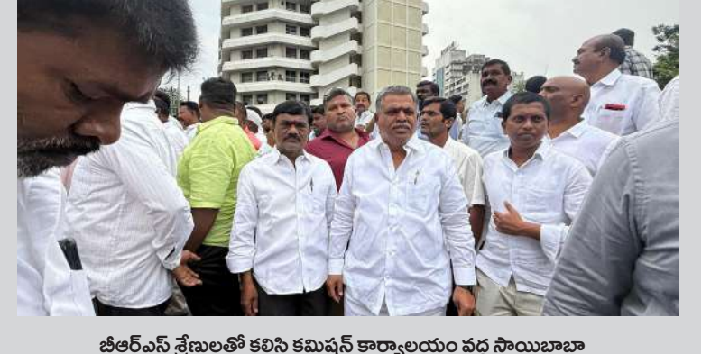
జీఆర్ఎస్ శ్రేణులతో కలిసి కమిషనర్ కార్యాలయం వద్ద సాయిబాబా