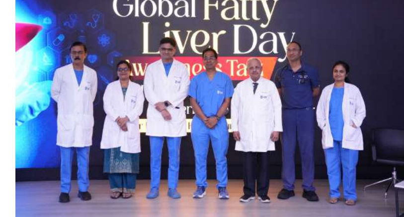
కార్యక్రమంలో పాల్గొన్న ఆసుపత్రి డాక్టర్లు