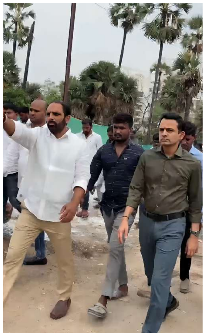
ఖాజాగూడ స్టేడియంను పరిశీలిస్తున్న జోనల్ కమిషనర్ హేమంత్ భోర్కడే