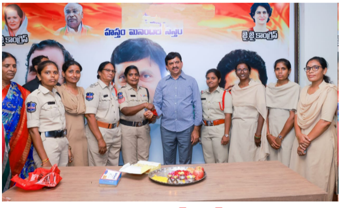
ఖమ్మం జిల్లా నివాస్ స్యూస్ ఆగస్టు 9