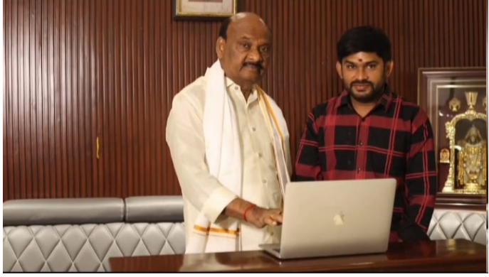
సర్వపట్నం నివాస్ స్యూస్ ఆగస్టు 9

అంధ్రప్రదేశ్ శాసనసభ సీక్రెటరీ చింతకాయల అయ్యన్నపాత్రుడు నేడు సర్వపట్నంలోని తన నివాసంలో ఏవీ.360 స్యూస్ ఛానల్ ఘనంగా ఆవిష్కరించారు. ఈ సందర్భంగా స్పీకర్ మాట్లాడుతూ "ప్రజలకు నిజమైన సమాచారం, సమగ్ర విశ్లేషణ అందించే స్యూస్ ఛానల్లు ప్రజాస్వామ్యానికి బలమైన పునాదులని నిష్పాక్షికత, పారదర్శకతతో రాష్ట్ర అభివృద్ధి / ప్రజల సమస్యల పరిష్కారం దిశగా ఏవీ,360 స్యూస్ ముందుదాని" అని ఛానల్ ప్రతినిధులకు అయ్యన్నపాత్రుడు తెలియజేశారు.