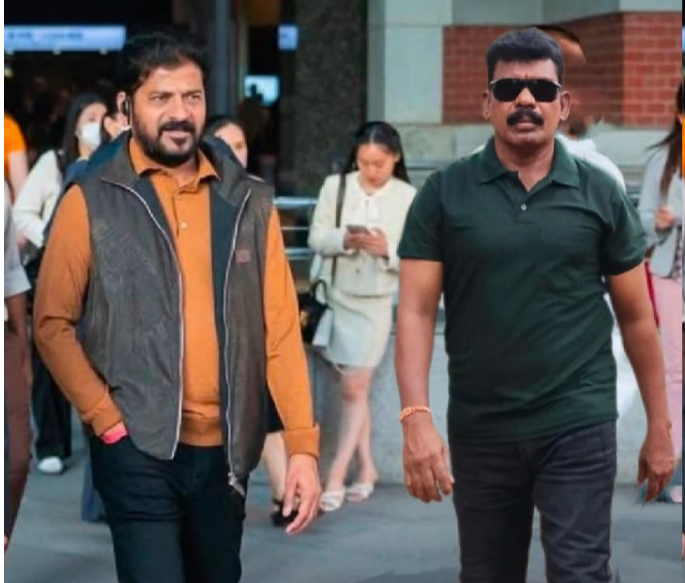
హైదరాబాద్ నివాస్ న్యూస్ ఆగస్టు 9 రాఖీ పండుగ సందర్భంగా తెలంగాణ ముఖ్యమంత్రి రేవంత్ రెడ్డి, శుభాకాంక్షలు తెలిపారు. మహిళా సాధి కారక సహా కోటిలక్షలను చేసే సంకల్పంతో ప్రజా ప్రభుత్వం కార్యక్రమాలు, పథకాల అమలు చేస్తున్నామని, ఉద్ఘాటించారు. రాష్ట్రాభివృద్ధిలో మహిళా లండరూ భాగస్వాములు యే వరకు ప్రజా ప్రభుత్వం అండగా ఉంటుందని చెప్పుకొచ్చారు. మహిళల రక్షణ, భద్రత, అభివృద్ధి, సంక్షేమంలో రాజీతేదన సీఎం రేవంత్ రెడ్డి, పేర్కొన్నారు.