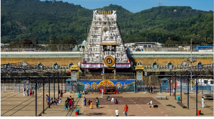
తిరుమల నివాస్ న్యూస్ ఆగస్టు 9 శ్రీవారి దర్శనాని కోసం భూదేవి కాంప్లెక్స్ వద్ద బారులు శ్రీవారి దర్శనం కోసం తీసుకోవడానికి టికెట్ కొంటర్ల వద్ద రద్దీ మధ్యాహ్నం 2 గంటల నుంచి పెద్ద సంఖ్యలో చేరుకున్న భక్తులు