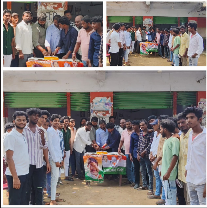
వైరా ప్రతినిధినివాస్ స్యూస్ ఆగస్టు 9