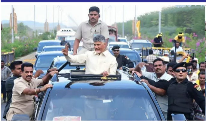
ఆంధ్రప్రదేశ్ నివాస్ న్యూస్ ఆగస్టు 9 ఆంధ్రప్రదేశ్ : ప్రపంచ ఆదివాసి దినోత్సవం సందర్భంగా శనివారం సీఎం చంద్రబాబు అల్లూరి జిల్లా పాడేరులో పర్యటించనున్నారు. ఉదయం గన్నవరం నుంచి హెలికాప్టర్లో లగిశపల్లికి చేరుకుంటారు. అక్కడి నుంచి ప్రత్యేక వాహనంలో వంజుగి గ్రామానికి వెళ్తారు. అభివృద్ధి కార్యక్రమాలకు శంకుస్థాపన చేస్తారు. ఆనంతరం ఆదివాసి దినోత్సవంలో పాల్గొని ప్రసంగిస్తారు. ఆ తర్వాత కూటమి నేతలతో సమావేశమవుతారు.