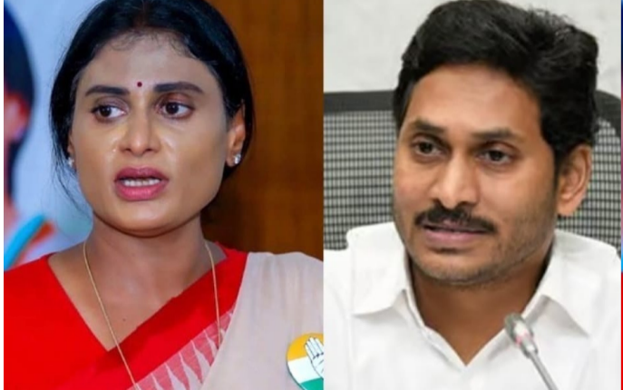
అంధ్రప్రదేశ్ నివాస్ స్యూస్ ఆగస్టు 9

తెలుగు రాష్ట్రాల్లో ఇద్దరు యువనాయకుల పరిస్థితి ఇంట్లో ఈగల మోత.. బయట పల్లెకీలో మోత అన్నట్లుగా మారింది. సొంత చెల్లెళ్లు రాఖీలు కట్టేందుకు సిద్ధంగా ఉండరు కానీ.. బయట నుంచి ఇతరులు మాత్రం వచ్చి.. మా అన్న మహాసభావుడు అని రాఖీలు కట్టేస్తూ ఉంటారు. సొంత చెల్లెళ్ల న్యాయం చేయని వారు బయట వారికే చేస్తారంటారని వారి ప్రత్యర్థులు విమర్శలు చేస్తారంటారు. ఈ సమస్యను వారు తెలివిగా పరిష్కరించుకోలేక రోడ్డుపై పడిపోతున్నారు. ఫలితంగా ఈ అన్నల ఇమేజ్ మనకబారిపోతోంది.