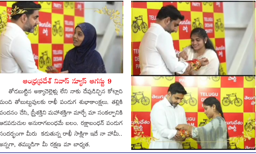
అంధ్రప్రదేశ్ నివాస్ స్యూస్ ఆగస్టు 9

తోడబుద్ధిన అక్కాచెల్లెళ్లు లేని నాకు దేవుడిచ్చిన కోట్లాది మంది తోబుట్టువులకు రాఖీ పండుగు శుభాకాంక్షలు. తల్లికి వందనం చేసి, స్త్రీశక్తిని మహాశక్తిగా మార్చి మా సంకల్పానికి ఆదరణలు అనురాగబంధమే బలం. రక్షాబంధన పండుగ సందర్భంగా మీరు కడుతున్న రాఖీ సాక్షిగా ఇదే నా హామీ.. అన్నా, తమ్ముడిగా మీ రక్షణ మా బాధ్యత.