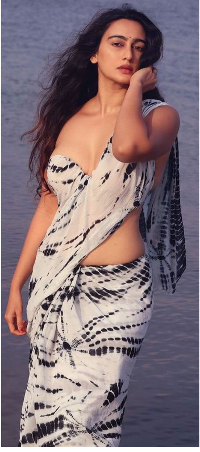
మేఘా హాట్ ఇన్ శారీ