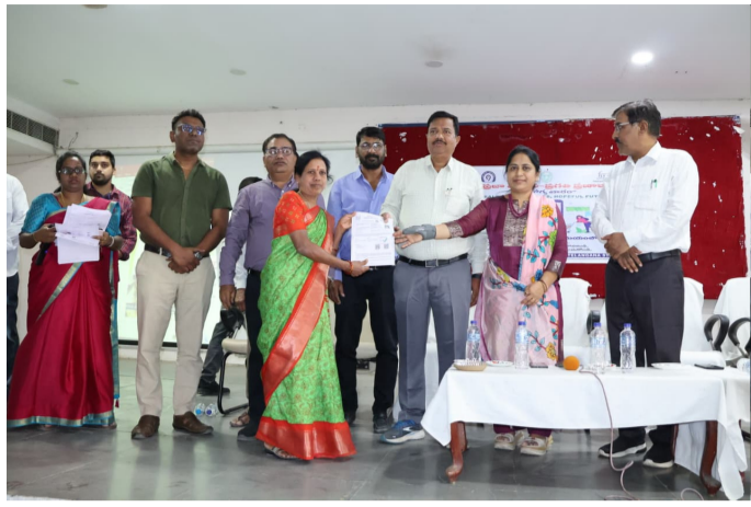
భద్రత శాఖ అధ్యక్షులలో బుధవారం జిల్లా కేంద్రంలోని రిమ్సీ ఆసుపత్రి నుండి జిల్లా పరిషత్ కార్యాలయం వరకు నిర్వహించిన వాకథాన్ను ఆయన ముఖ్య అతిథిగా హాజరై జెండా ఊపి ప్రారంభించారు. అనంతరం జిల్లా సమావేశ మందిరంలో నిర్వహించిన సమావేశంలో అదనపు కలెక్టర్ మాట్లాడుతూ, ప్రతి ఒక్కరూ నాణ్యమైన, పోషక విలువలు కలిగిన ఆహారాన్ని తీసుకోవడం ద్వారానే సంపూర్ణ ఆరోగ్యాన్ని సాధించగలరని సూచించారు. ప్రస్తుత తరుణంలో తీసుకునే ఆహారంలో రసాయనాల వాడకం ఎక్కువైందని, వాడకం వల్ల అనారోగ్యం బారిన పడుతున్నారన్నారు. పోషకాలతో కూడిన ఆహారం తీసుకోవడం వలన రోజంతా ఉత్సాహంగా ఉంటారని సూచించారు. ప్రతి ఒక్కరూ ఆరోగ్యం పట్ల శ్రద్ధ వహించాలని, ఆహారం, నిద్ర సరైన సమయానికి తీసుకోవాలన్నారు. సరైన ఆహారం తీసుకుంటూ - ఆరోగ్యంగా ఉండాలి అనే నినాదంతో ప్రజలు తమ ఆహారపు అలవాట్లలో మార్పులు చేసుకోవాలని పిలుపునిచ్చారు. అనంతరం పలువురికి ఫుడ్ ట్రైసిన్స్ లను అదనపు కలెక్టర్ చేతుల మీదుగా అందజేశారు. ఈ కార్యక్రమంలో జిల్లా ఆహార భద్రత అధికారి ప్రత్యూష, జిల్లా సంక్షేమ అధికారి మిల్కా జిల్లా వైద్యారోగ్య శాఖ అధికారి నరేందర్ రాథోడ్, రిమ్సీ డైరెక్టర్ బై సింగ్ రాథోడ్, ఫుడ్ సేఫ్టీ కంట్రోలర్ నాయక్, వైద్యులు డివక్ పుషర్, నరేందర్, ఇతర అధికారులు, అంగన్వాడీలు, విద్యార్థులు, తదితరులు పాల్గొన్నారు.