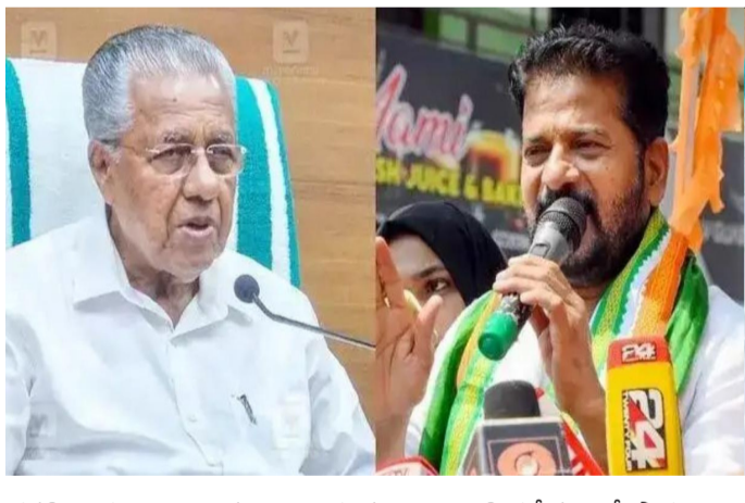
ప్రకటించారు. 64,006 కుటుంబాలను గుర్తించి, వారికి ప్రత్యేక మైక్రో-ప్లాన్ల ద్వారా ఉపాధి, ఆసరా కల్పించాలని వివరించారు.

హైదరాబాద్.అమృత్ తెలంగాణ: కేరళం, తెలంగాణ ముఖ్యమంత్రుల మధ్య సోషల్ మీడియా వేదికగా సాగుతున్న మాటల యుద్ధం ముదిరింది. కేరళ ప్రభుత్వ పనితీరుపై రేవంత్ రెడ్డి చేసిన విమర్శలకు స్పందిస్తూ, కేరళం సీఎం పినరయి విజయన్ ఒక బహిరంగ లేఖ విడుదల చేశారు. రాజకీయ విభేదాలను పరిష్కరించుకోవడానికి వ్యక్తిగత దూషణలకు దిగడం సరికాదని ఆయన రేవంత్ కు హితవు పలికారు.