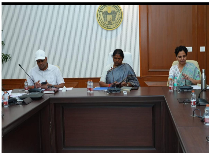
పనినినాలు కల్పించాలి ఏజెన్సీ ప్రాంతాల్లో పెసా చట్టం పూర్తి స్థాయిలో అమలు అయ్యేలా చర్యలు తీసుకోవాలి పెసా పరిధిలో 1289 గ్రామ పంచాయతీలున్నాయి అధికారులు, ప్రజా ప్రతినిధులకు త్వరలో శిక్షణ కార్యక్రమాలు నిర్వహించి పెసా చట్టాలపై అవగాహన పెంచాలి