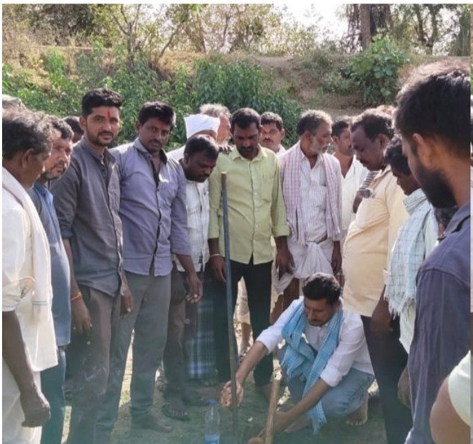
ఉపాధి హామీ పనులను ప్రారంభించిన సర్పంచ్