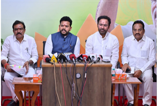
మీడియా సమావేశంలో మాట్లాడుతున్న కేంద్రమంత్రి కిషన్ రెడ్డి మరియు రామ్మోహన్ నాయుడు