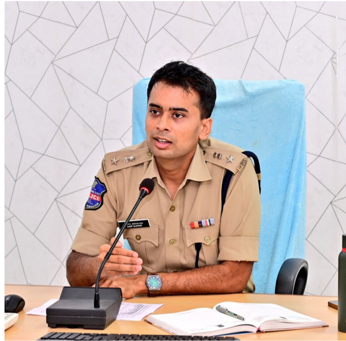
ఆదిలాబాద్ జిల్లా ఎస్పీ అఖిల్ మహాజన్

డయల్ 100 లేదా 8712659953 నెంబర్ ద్వారా షీ టీం కు సంప్రదించవచ్చు : జిల్లా ఎస్పీ అఖిల్ మహాజన్