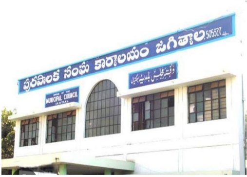
జగిత్యాల అమృత్ తెలంగాణ ఏప్రిల్ 09: జగిత్యాల మున్సిపాలిటీ కమిషనర్ కార్యాలయంలో నిన్న ఏ సీ బి అధికారులు ఆకస్మిక తనిఖీలు నిర్వహించారు. ఈ తనిఖీల్లో పలు అర్థిక, పరిపాలనా లోపాలు బయటపడ్డాయి. పన్నుల వసూళ్లలో భారీ లోటు 2025-26 ఆర్థిక సంవత్సరానికి సంబంధించిన వివరాలు ఇలా ఉన్నాయి, ప్రావర్తి

ట్యూక్స్: పనులు చేయాల్సింది rs14.76 కోట్లు పసూలైనది rs7.52 కోట్లు మిగిలిన బకాయిలు rs7.23 కోట్లు షాపింగ్ కాంప్లెక్స్ పన్ను: పనులు చేయాల్సింది ? 2.35 కోట్లు పసూలైనది rs1.43 కోట్లు బకాయి rs91.88 లక్షలు అడ్వర్టైజ్మెంట్ ట్యూక్స్ పనులు చేయాల్సింది rs8.12 లక్షలు పసూలైనది rs0 మొత్తం బకాయి rs8.12 లక్షలు మొత్తం బకాయి: rs8.23 కోట్లు ACB గుర్తించిన ప్రధాన అవకతవకలు 2022 నుంచి 4 ఆలోలు, 2020 నుంచి ఒక ట్రాక్టర్ కనిపించకుండా పోయినా ఎలాంటి చర్యలు తీసుకోలేదు. వాహన మరమ్మత్తుల చెల్లింపులు నిబంధనలు ఉల్లంఘించి వ్యక్తిగత పేర్లపై చెక్కులు జారీ చేశారు. వాహనాలను స్థానికంగా కాకుండా కరీంనగర్ లోని ప్రైవేట్ గ్యారేజీలకు తరలించి సర్వీసింగ్ చేశారు. వాహనాల లాగిబుక్స్, ఇంధన వినియోగ రికార్డులు సరిగ్గా నిర్వహించలేదు.