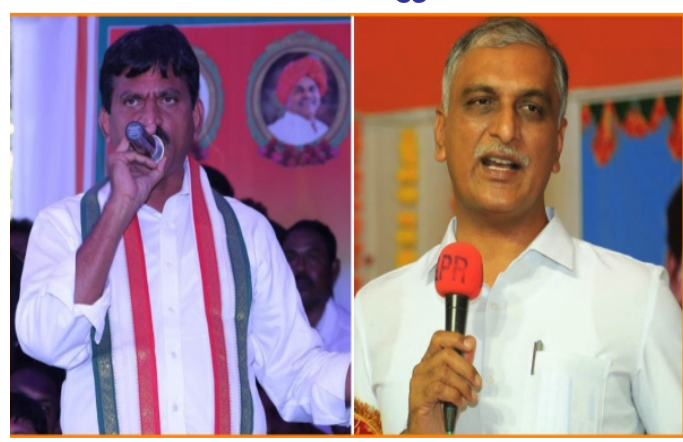
కాగా, నాదర్ గుల్లో భూముల వ్యవహారంపై ఇటీవల రాజకీయ దుమారం చెలరేగుతోంది. రూ.7 వేల కోట్ల విలువైన 373 ఎకరాల ప్రభుత్వ భూమిని కాంగ్రెస్ ప్రభుత్వం ప్రయవేలు కంపెనీలకు కట్టబెట్టిందని హరీష్ రావు ఆరోపిస్తున్నారు. అయితే ఈ భూమి యజమాని ఏకాగ్ రియాలిటీ అని చెబుతున్నారు. ఇది ప్రైవేటు భూమి అని హైకోర్టు సుప్రీంకోర్టు గుర్తించాయని ఏకాగ్ రియాలిటీ అధ్యక్షుడు ఇటీవల తెలిపారు.

హైదరాబాద్ :అమృత్ తెలంగాణ: నాదర్ గుల్లో భూములను 2014లోనే నాటి బీఆర్ఎస్ ప్రభుత్వం మూడు సంస్థలకు అప్పగించిందని, వారి హయాంలోనే ఆ సంస్థల పేరిట రిజిస్ట్రేషన్, మ్యూటీషన్ కూడా జరిగిందని తెలంగాణ మంత్రి పాంగులేటి శ్రీనివాస్ రెడ్డి ఆరోపించారు. నాడు జరిగిన రిజిస్ట్రేషన్ తమ ప్రభుత్వానికే సంబంధమని మండిపడ్డారు. నాదర్ గుల్లో భూములను తమ ప్రభుత్వం హయాంలో కట్టబెట్టినట్లు ఆరోపణలు చేయడాన్ని ఆయన ఖండించారు. హరీష్ రావు చెబుతోన్న భూముల్లో 2022లోనే నిర్మాణాలు ప్రారంభమయ్యాయని అన్నారు. ఆ సమయంలో బీఆర్ఎస్ అధికారంలో ఉందని గుర్తు చేశారు. తమకు నాలా కన్వర్షన్ ఇవ్వలేదని భూములు పొందినవారు 2022లో సుప్రీంకోర్టులో పిటిషన్ దాఖలు చేస్తే, నాటి కేసీఆర్ ప్రభుత్వం కనీసం కౌంటర్ దాఖలు చేయలేదని ఆరోపించారు. తమ ప్రభుత్వం వచ్చాక ఆ భూములు ప్రభుత్వానివేనని కౌంటర్ దాఖలు చేశామని వెల్లడించారు. నాడు వాటాల కోసం భూములు కట్టబెట్టిన వారు ఇప్పుడు తమపై నిందలు మోపుతున్నారని ఆగ్రహం వ్యక్తం చేశారు. హరీష్ రావు చెబుతున్న కంపెనీల్లో తన కుటుంబ సభ్యులు ఎవరూ లేరని పాంగులేటి శ్రీనివాస్ రెడ్డి స్పష్టం చేశారు. నాదర్ గుల్లో భూముల వ్యవహారానికి సంబంధించిన కంపెనీల్లో తన కుటుంబ సభ్యులు ఎవరైనా ఉంటే నిరూపించాలని సవాల్ చేశారు.