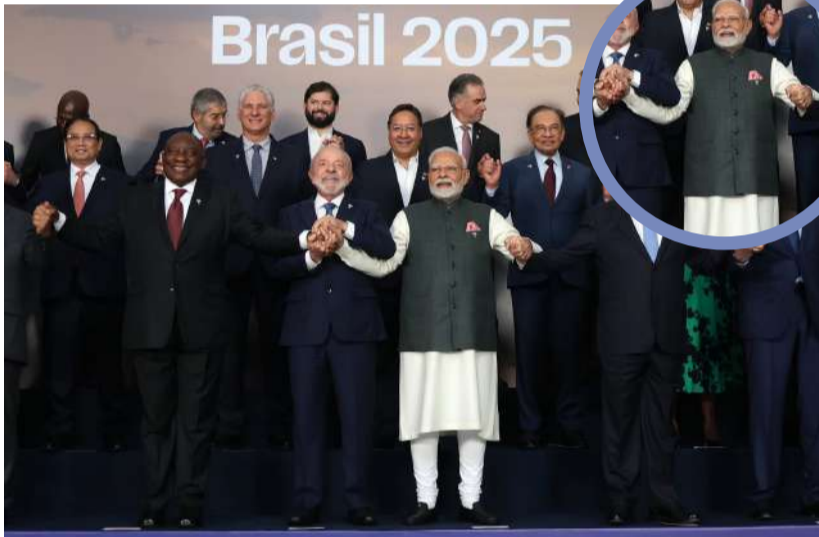
BRICS Brasil 2025

ఈ కబురు: వచ్చే ఏడాది బ్రిక్స్ కు కొత్త రూపం ఇచ్చేందుకు భారత్ ప్రయత్నిస్తుందని ప్రధాని నరేంద్ర మోడీ అన్నారు. బ్రెజిల్ లోని రియో డి జనిరోలో జరుగుతున్న 17వ బ్రిక్స్ సదస్సు చివరి రోజున ఆయన ఈ వ్యాఖ్యలు చేశారు. 2026లో భారత్ లోనే బ్రిక్స్ సదస్సు జరగనుంది. ఈ నేపథ్యంలో బ్రెజిల్ నుంచి బ్రిక్స్ నాయకత్వాన్ని భారత్ అందుకోనుంది. ఈ క్రమంలోనే మోడీ ఈ వ్యాఖ్యలు చేశారు. 'బ్రిక్స్ ను మా ప్రెసిడెన్సీలో కొత్త మార్గంలో నడిపించే ప్రయత్నం