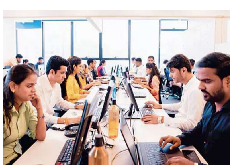
ఫిన్టెక్ దిగజీవనం భాగంగా 40% (4,000 మంది) ఉద్యోగాలను తొలగించినట్లు ఈ ఏడాది ప్రారంభంలో ప్రకటించింది. కొత్త నైపుణ్యాలే గిరాకీ: సాధారణ బటి సేవల రంగంలో వార్షిక నియామక వృద్ధి 4 6% కాగా, గ్రోబల్ క్యాపబిలిటీ సెంటర్ల (జీసీసీ)లో వివే, డేటా, సైబర్ సెక్యూరిటీ విభాగాల్లో 18 27% వృద్ధి సమాధి దవుతోంది. నూతన విభాగాల్లో నైపుణ్యాల కొరత 2560 శాతంగా ఉంటుంది. అందుకే కంపెనీలు వివే నిపుణులకు 1012% వేతన వృద్ధి ఇస్తున్నాయి.

40% మెరుగైన ఫలితాలు వస్తున్నాయి. ఇంకా చాలా సంస్థలు వివేచి వినియోగంలో ప్రాథమిక దశలోనే ఉన్నందున, దీనిద్వారా వచ్చే ఆదాయంపై స్వచ్ఛమైన ఆధారాలు పరిమితంగానే ఉన్నాయి. ఉద్యోగ భద్రతపై అందోళన: దిగజీవనంపై భారీ లెవెన్యూ కారణంగా, 60 శాతానికి పైగా టెక్ ఉద్యోగులు తమ వృత్తిని విడిచి వేరే ఉద్యోగాలు చేస్తున్నారు. ఒకానొక, గూగుల్, మెటా వంటి సంస్థల్లో జరుగుతున్న 'సెలెక్షన్ టాలెంట్లు' బటి నిపుణుల్లో తీవ్ర ఆందోళన రేపిస్తున్నాయి. 'ఉద్యోగాలు సిస్టమ్లో లాగిన అవకాశం, వారి బడి కార్డులను డియాక్టివ్ చేస్తూ.. ఉదయం 6 గంటల ప్రాంతంలో ఇమెయిల్ ద్వారా పంపుతున్న ఆటోమేటెడ్ తొలగింపు నోటీసులతో ఇందుకు కారణం. సంప్రదాయ బటి ఉద్యోగాలు వృద్ధి చెందకపోవడం, డిజిటల్ ఉద్యోగాలు పెరగడం వంటి పరిణామాల వల్ల మధ్యస్థాయి నిపుణులు తీవ్ర అల్పిని ఎదుర్కొంటున్నారు. నైపుణ్యాల పెంచుకునేందుకు తగిన మద్దతు ఇవ్వక పోవడం వల్ల, సామాజిక ప్రభావం అధికంగా ఉండడం.