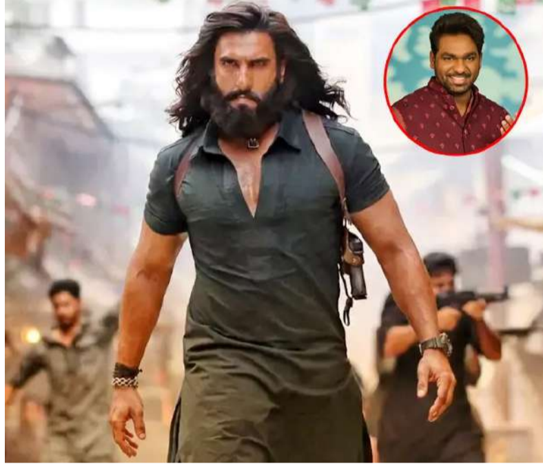
జాబితాలో ఉన్న 'బాహుబలి 2', 'పుష్ప 2'ల సరసన 'ధురంధర్ 2' కూడా చేరింది.