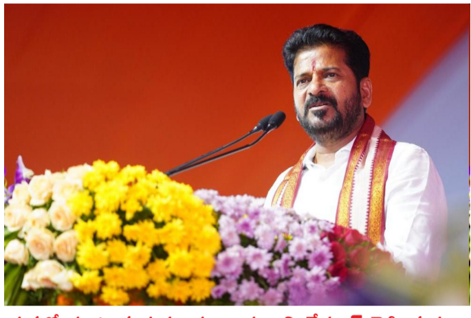
సభలో మాట్లాడుతున్న ముఖ్యమంత్రి రేవంత్ రెడ్డి దృశ్యం