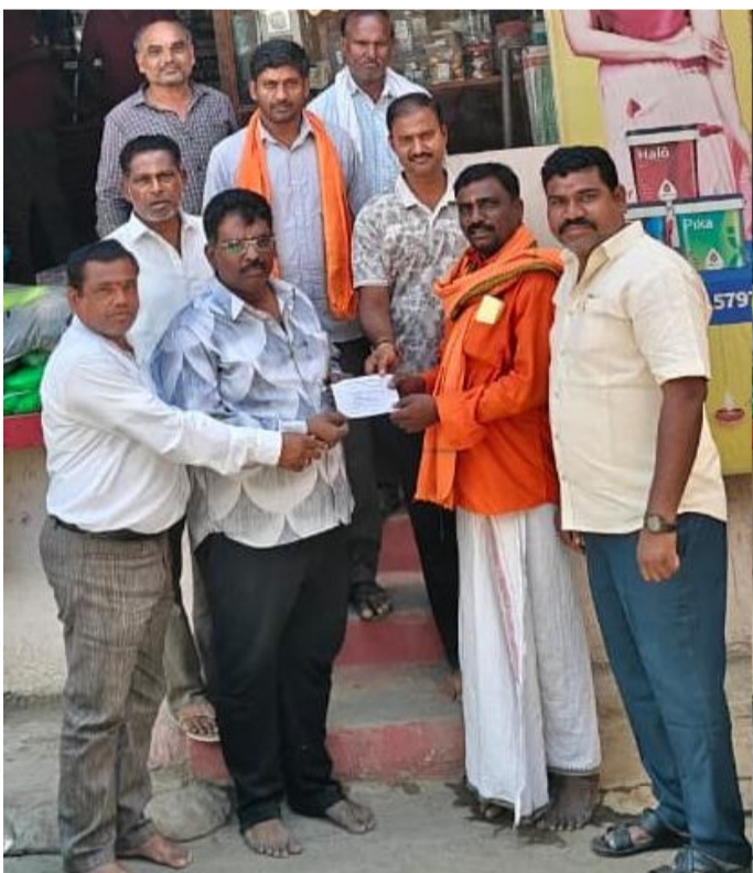
ఇంటింటికి కరపత్రములు అందిస్తున్న హిందూ సమైక్యత కమిటీ సభ్యులు