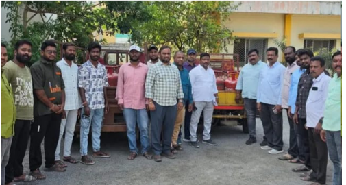
కోరుట్ల అమృత్ తెలంగాణ ఏప్రిల్ 06: జగిత్యాల జిల్లా కోరుట్లలో సోమవారం నాడు పట్టణంలోని పలు హోటళ్లలో

సివిల్ సప్లై రెవెన్యూ శాఖ అధికారులు తనిఖీలు నిర్వహించారు. ఈ తనిఖీల్లో భాగంగా అక్రమంగా వినియోగిస్తున్న 48 ఎల్పీజి గ్యాస్ సిలిండర్లను అధికారులు స్వాధీనం చేసుకున్నారు. ఈ సంఘటనతో పట్టణంలో కలకలం రేగింది. గృహ వినియోగ గ్యాస్ ను వాణిజ్యంగా ఉపయోగించడం చట్టవిరుద్ధమని, అక్రమాలకు పాల్పడితే కఠిన చర్యలు తీసుకుంటామని సివిల్ సప్లై డి.టి ఉమావతి హెచ్చరించారు. భవిష్యత్తులోనూ ఇలాంటి దారులు కొనసాగుతాయని తెలిపారు. అధికారులు ఈ అక్రమాలకు పాల్పడిన వారిపై చర్యలు తీసుకునే అవకాశం ఉంది.