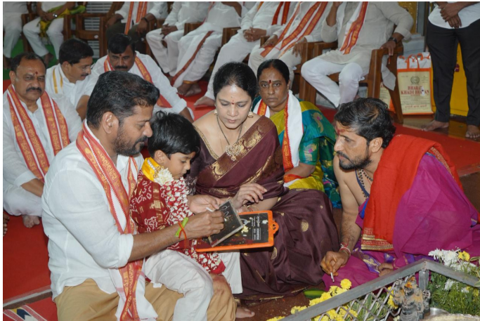
ముఖ్యమంత్రి మనుమడికి బాసర సరస్వతి అమ్మవారి సన్నిధిలో అక్షరాభ్యాసం చేయిస్తున్న దృశ్యం