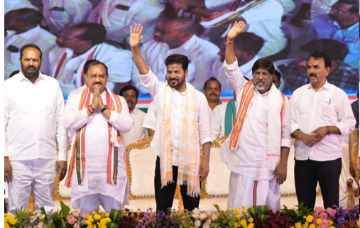
ప్రజల సమస్యలను తెలియజేస్తున్న సీఎం మరియు డిప్యూటీ సీఎం