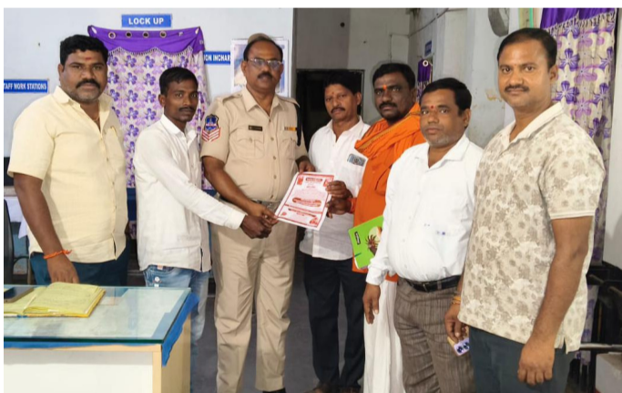
పోలీస్ సిబ్బందికి అహ్వాన పత్రక అందజేస్తున్న హిందూ సమైక్యత కమిటీ కుబ్జీ

నిర్మల్ జిల్లా కుబ్జీ ఏప్రిల్ 6 అమృత్ తెలంగాణ కుబ్జీ గ్రామంలోని శ్రీ విఠలేశ్వర మందిరం నందు ఏప్రిల్ 7 సాయంత్రం నాలుగు గంటలకు-హిందూ సమైక్యత-ఈ కార్యక్రమము రాష్ట్రీయ స్వయం సేవక్ సంఘ స్థాపించి 100 సంవత్సరాలు గడిచిన శుభ సందర్భంగా-అత్యుచితమైన సోదరి సోదరులు-