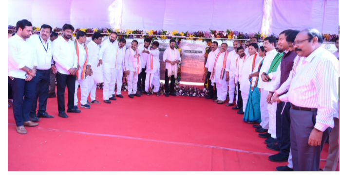
శిలాఫలకాన్ని అవిష్కరిస్తున్న తెలంగాణ రాష్ట్ర ముఖ్యమంత్రి రేవంత్ రెడ్డి