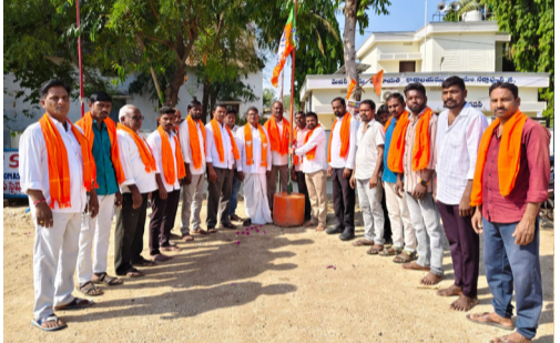
సర్పాపూర్ జి మండల కేంద్రంలో ఘనంగా బీజేపీ అభిర్వాహ దినోత్సవ వేడుకలు పెద్ద ఎత్తున పాల్గొన్న బీజేపీ కార్యకర్తలు