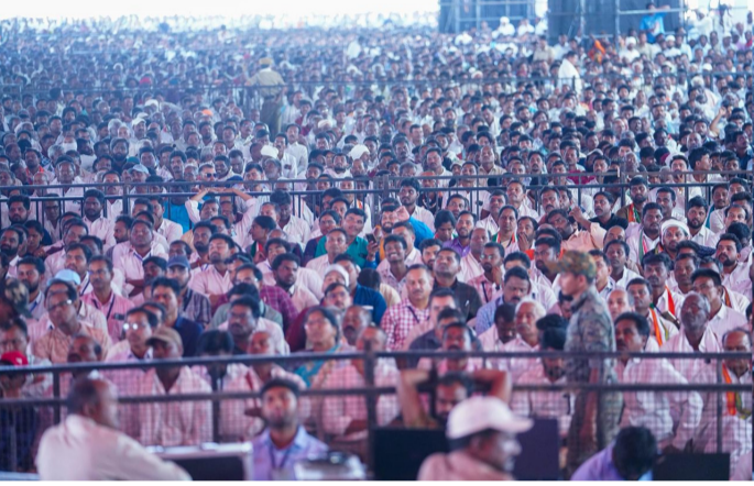
సభకు హాజరైన ప్రజలు