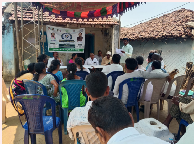
కోటపల్లి ఏప్రిల్ 02, (జనోదయ):

పిన్నారం గ్రామంలో ప్రజా పాలనా - ప్రగతి ప్రణాళిక 99 రోజుల కార్యక్రమం.